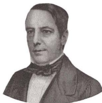
Nabuco de Araújo

Fonte: Nabuco de Araújo por A. Sisson in: ASSIS. Machado de. O Velho Senado . Senado Federal: Brasília, 2004, p.47.