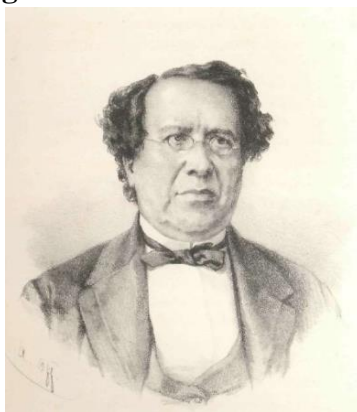
Figura 3 - Visconde de Inhomirim

Fonte: Visconde de Inhomirim in: ALMEIDA, Tito Franco. A Grande Política: Balanço do Imperio no Reinado Actual - Liberaes e Conservadores - estudo político-financeiro. Rio de Janeiro: Imperial Instituto Artistico, 1877.