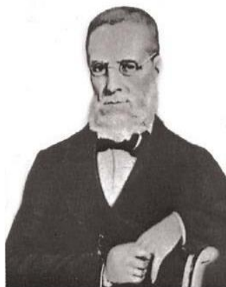
Marquês de Sapucaí