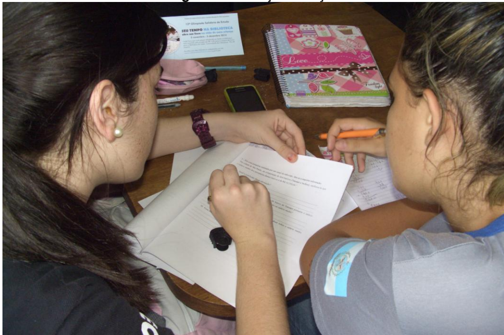
Figura 2 – Situação de Ação

Desta feita, propiciamos o momento da situação de ação , em que o aluno indiretamente utiliza os seus recursos de conhecimentos construídos para a resolução do problema, sem se preocupar com as formalidades que exigem na resolução de um problema matemático, Figura 2. Ou faz a tarefa de acordo com o que sabe, ou lembra, a respeito desse assunto.