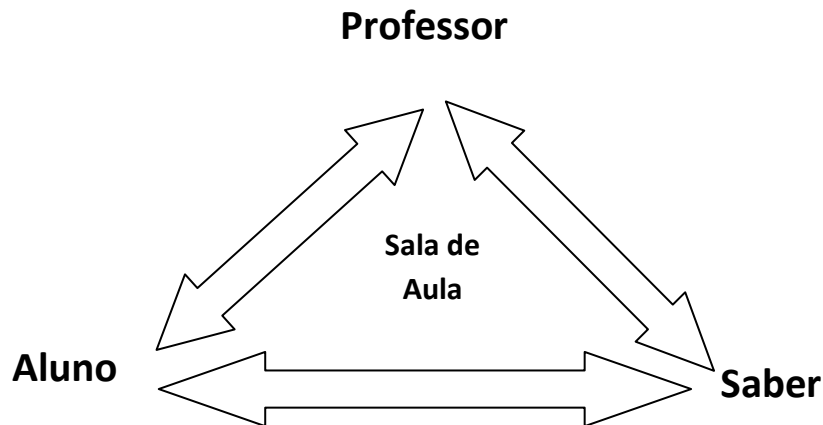
Figura 1 - O Triângulo Didático