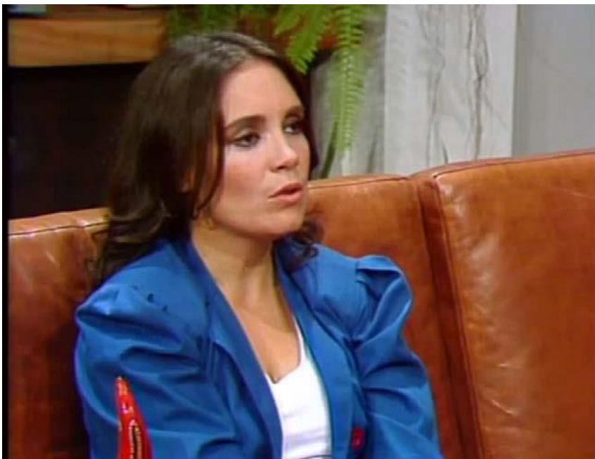
Figura 9: Malu informa a uma amiga que vai pedir o desquite.