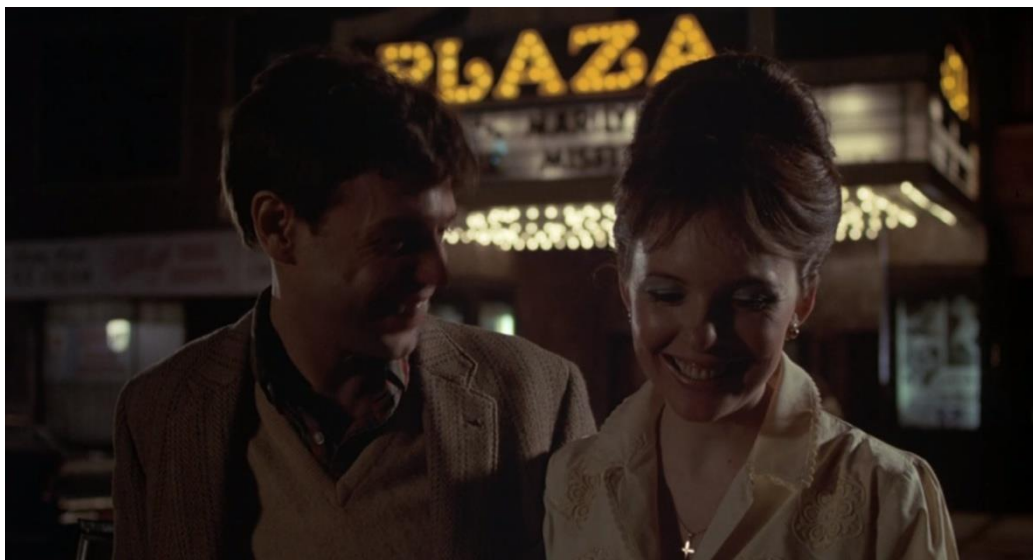
Figura 28: Annie em sua juventude.