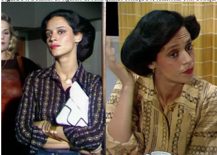
Figura 54: Detalhes do figurino de Julia quando começa a se relacionar com Ubirajara.

Fonte: Print screen do DVD de Dancin' Days capturado de acervo particular. À esquerda, Disco 5 às 02h e 03 min. À direita, Disco 5 às 01h e 54 min.