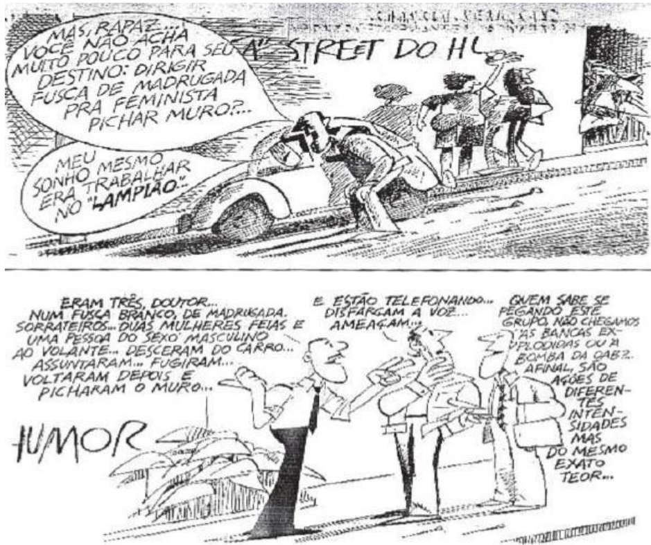
Figura 2: Charge de Ziraldo feita para o jornal O Pasquim em 1980.

pontua que, a partir de então, ele começou a expressar sua opinião acerca do feminismo em várias de suas charges em O Pasquim . Em uma “charge-resposta” sobre o ocorrido, é possível observar claramente a questão da beleza como forma de depreciação retornando.