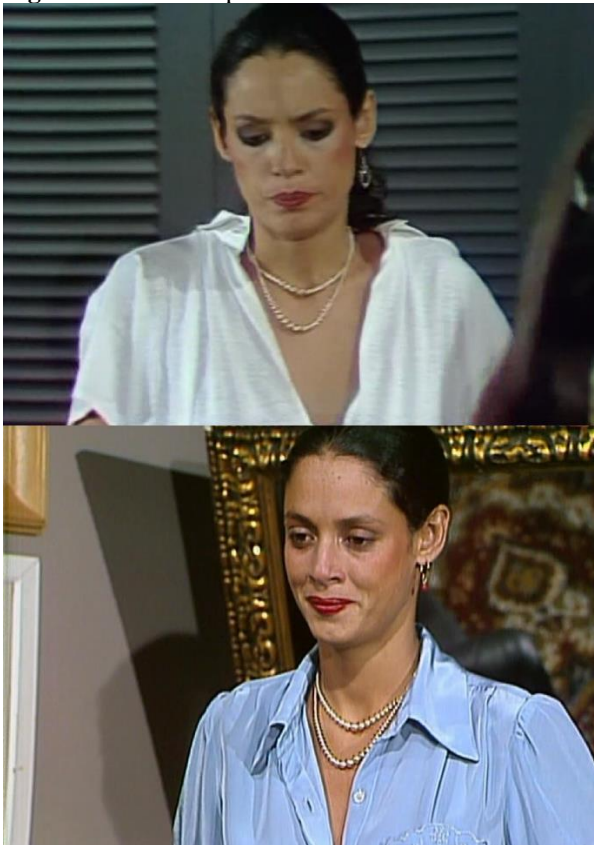
Figura 58: Julia simplifica o visual.

Fonte: Print screen do DVD de Dancin' Days capturado de acervo particular. Acima, Disco 9 às 01h e 25 min. Abaixo, Disco 12 aos 04 min e 43 seg.