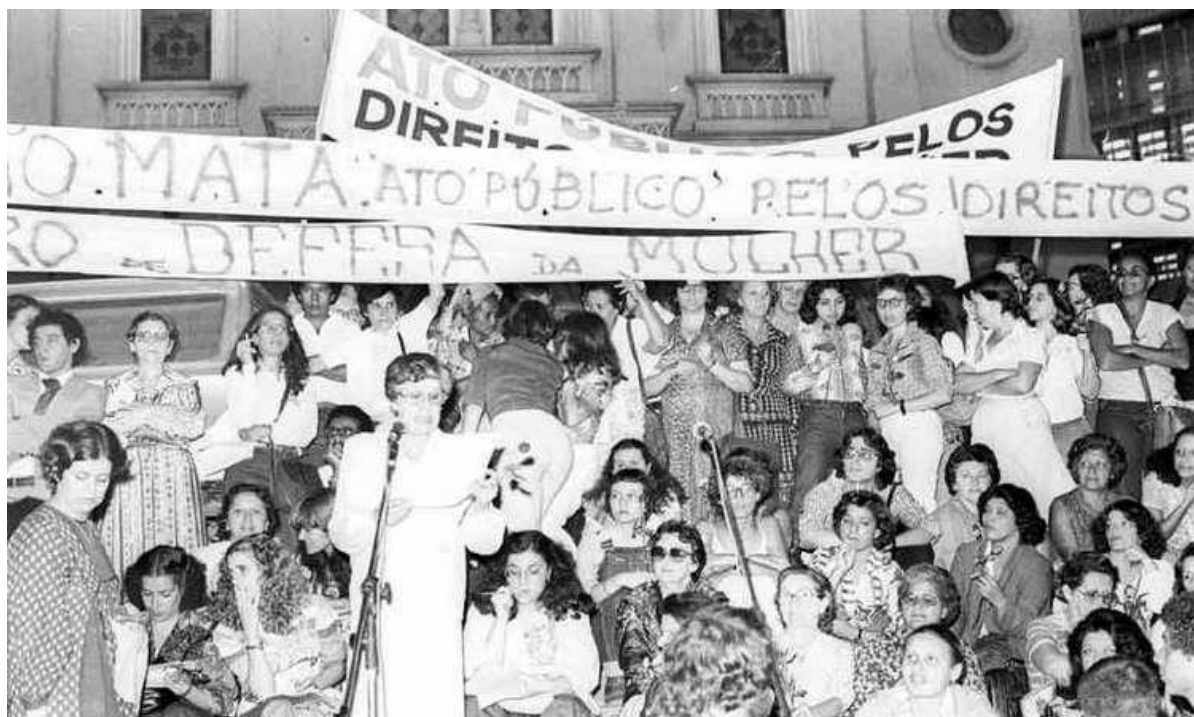
Figura 3: Ato “Quem ama não mata” em 18 de agosto de 1980.

Fonte: Arquivo Estado de Minas. Disponível em: < https://www.em.com.br/app/noticia/pensar/2018/11/02/interna_pensar,1002486/quem-ama-nao-matadois-tempos.shtml > Acesso em: 21 dez. 2021.