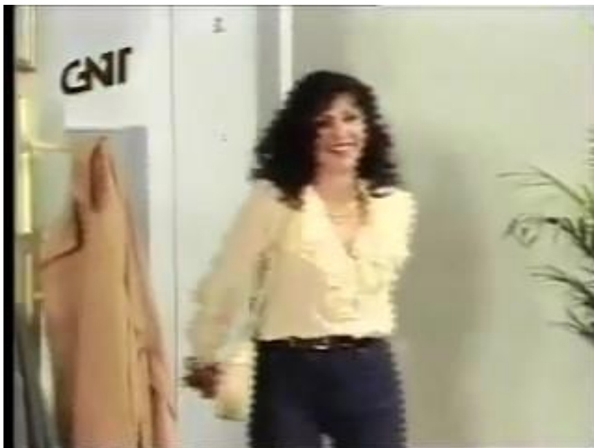
Figura 38: Alice vai a um encontro.