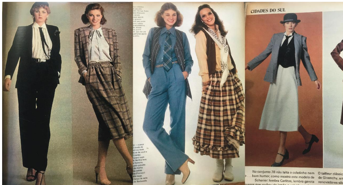
Figura 70: Imagens retiradas de Manequim . À esquerda, nº220, abril de 1978. Ao meio e à direita, nº222, junho de 1978.