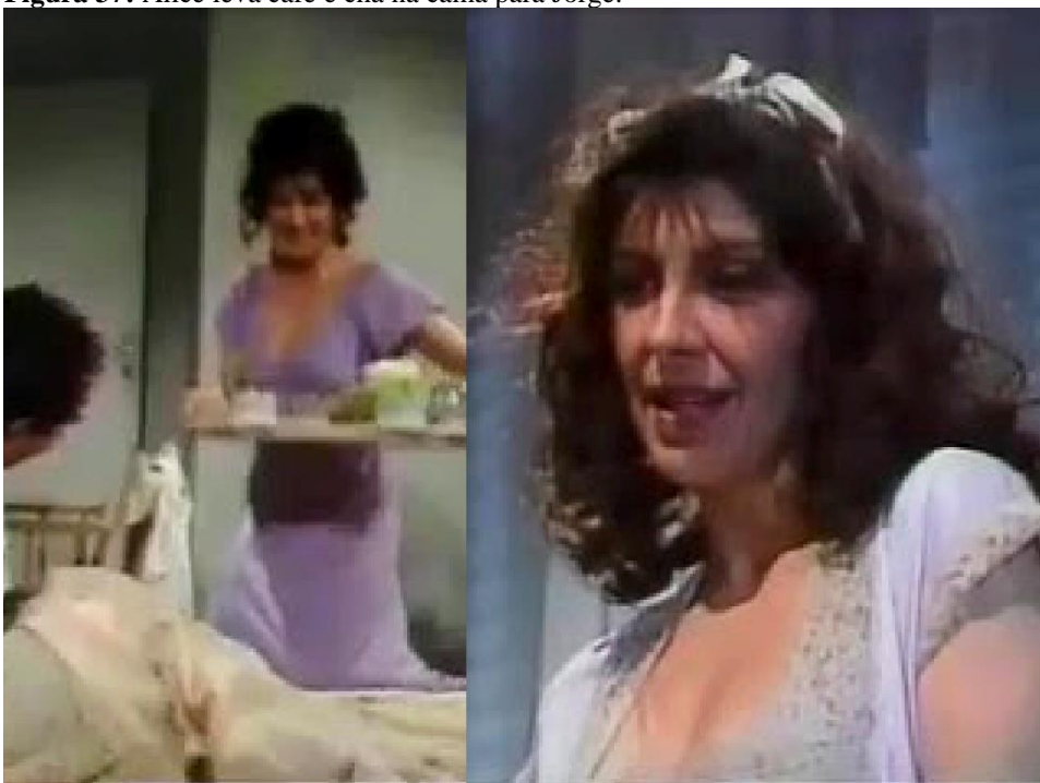
Figura 37: Alice leva café e chá na cama para Jorge.