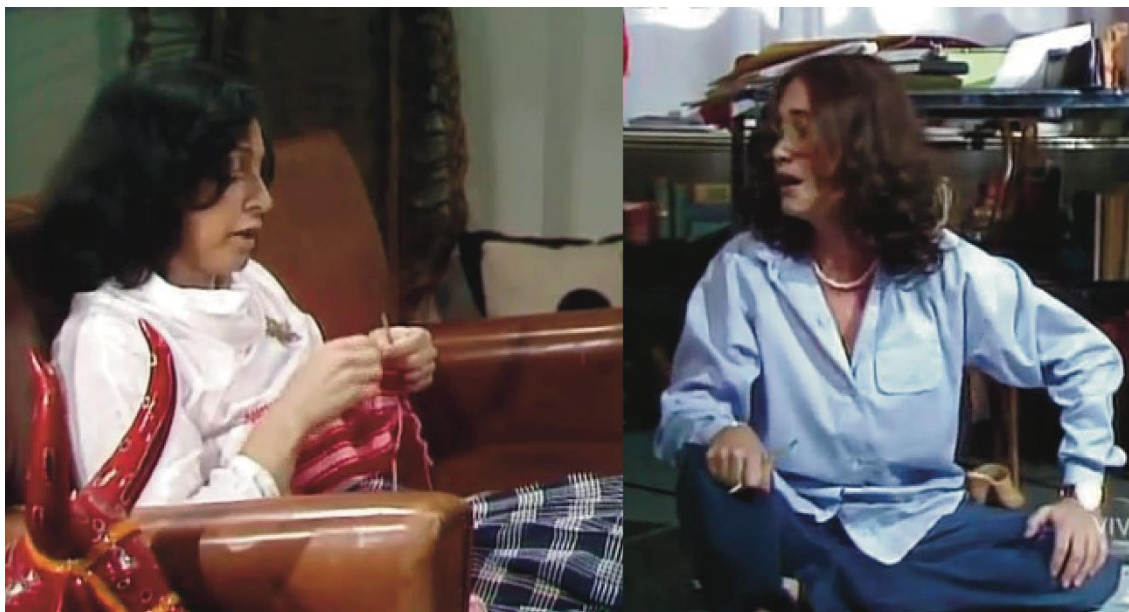
Figura 23: Malu e sua mãe conversam sobre sexualidade.