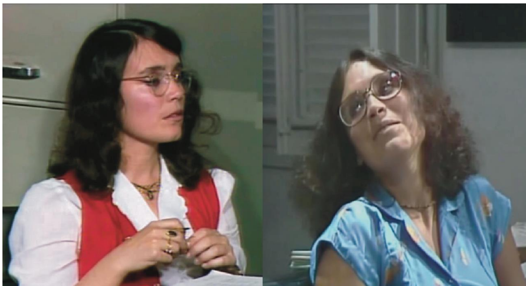
Figura 16: Malu no ambiente de trabalho.

Fonte: À esquerda, print screen do episódio “A Amiga” de Malu Mulher capturado de acervo particular aos 12 min e 07 seg. À direita, print screen do episódio “Com que roupa” de Malu Mulher capturado de acervo particular aos 05 min e 26 seg.