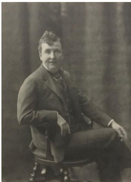
Figura 13: Jane Dieulafoy fotografada por volta de 1900.

Christine Bard (2010), em seu estudo sobre os significados políticos da calça comprida, explica que, no século XIX, um número significativo de mulheres francesas famosas adotou a peça como parte de seu guarda-roupa. Naquele momento, como se vê na imagem acima, os paletós acinturados, os coletes e até as gravatas foram apropriados do traje masculino, mas havia um tabu com a utilização das calças, que era restrita apenas aos homens. Nomes como o da escritora George Sand (1804-1876) 127 , a artista plástica Rosa Bonheur (1822-1899) 128 , a arqueóloga Jane Dieulafoy (1851-1916) 129 , a atriz Sarah Bernhardt (1844-1923) 130 , entre outras, estão presentes na pesquisa de Bard e apesar do uso da peça em comum, possuem modos de vestir e posicionamentos políticos distintos.