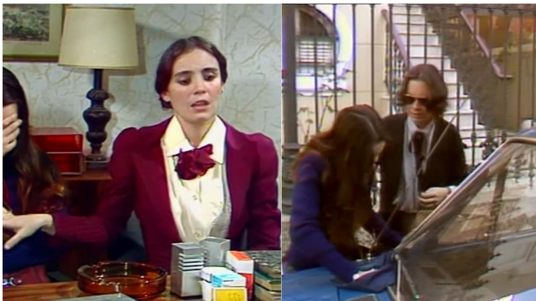
Figura 21: À esquerda, Malu leva Jô ao seu ginecologista na esperança que esse a ajude. À direita, Malu e Jô saem da clínica após o procedimento.