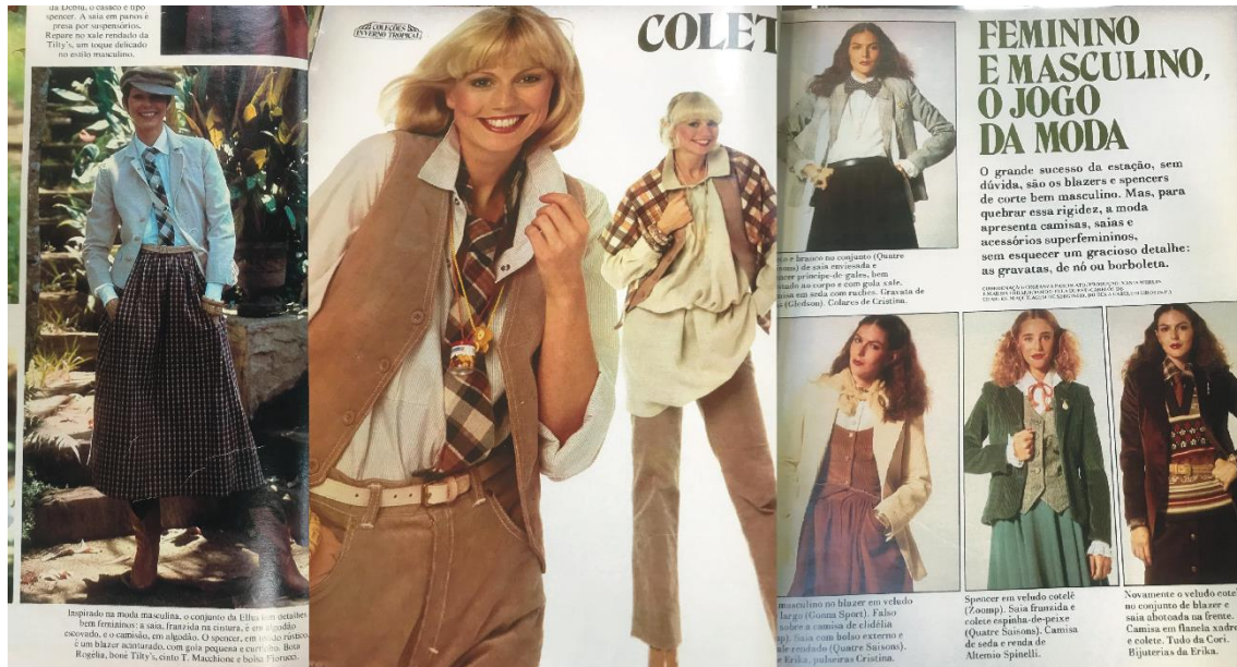
Figura 69: Imagens retiradas de Claudia . À esquerda e ao meio, nº199, abril de 1978. À direita, nº202, julho de 1978.