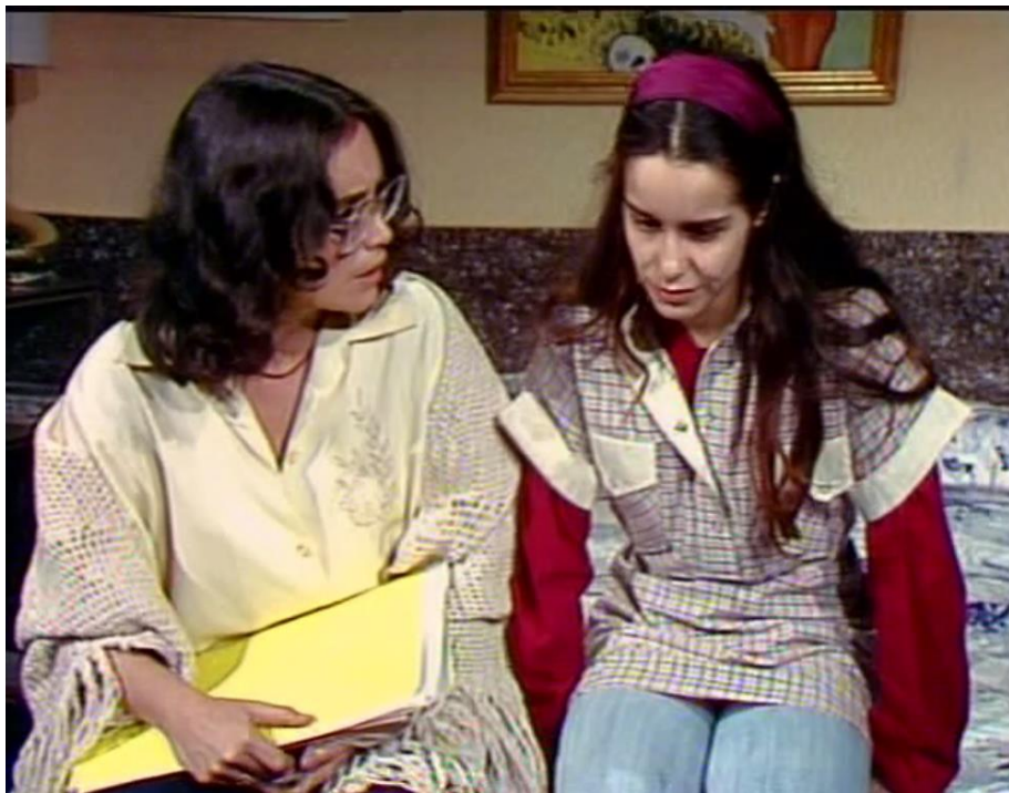
Figura 20: Malu tenta convencer Jô a prosseguir com a gravidez.