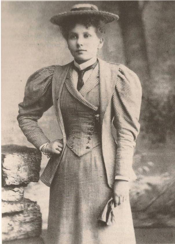
Figura 12: Mulher de classe média em traje “alternativo” na Inglaterra (1983).