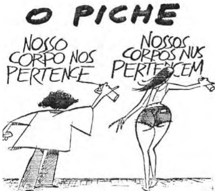
Figura 1: Charge feita por Ziraldo para o Jornal do Brasil em 1980.