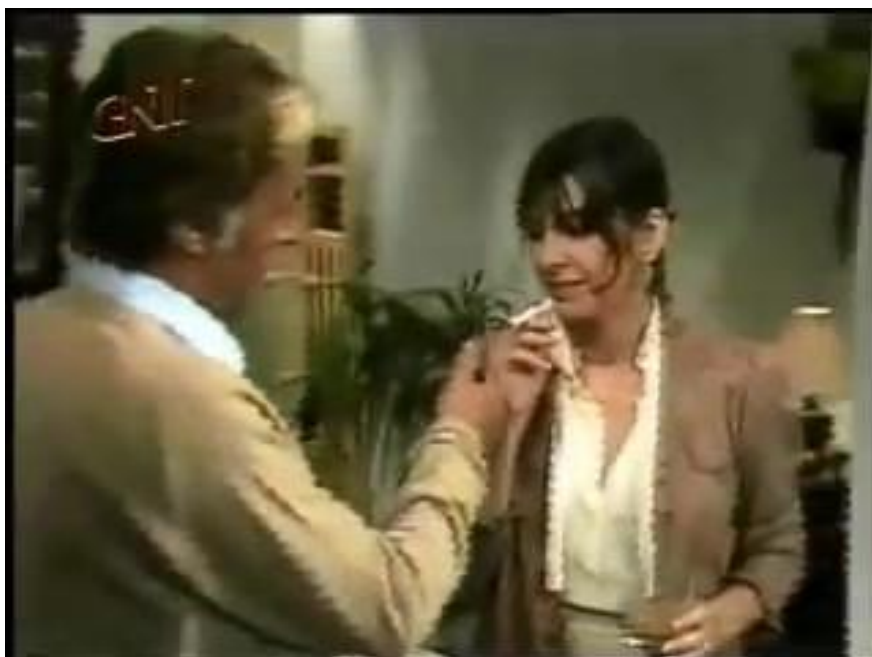
Figura 39: Alice conversando com Raul.