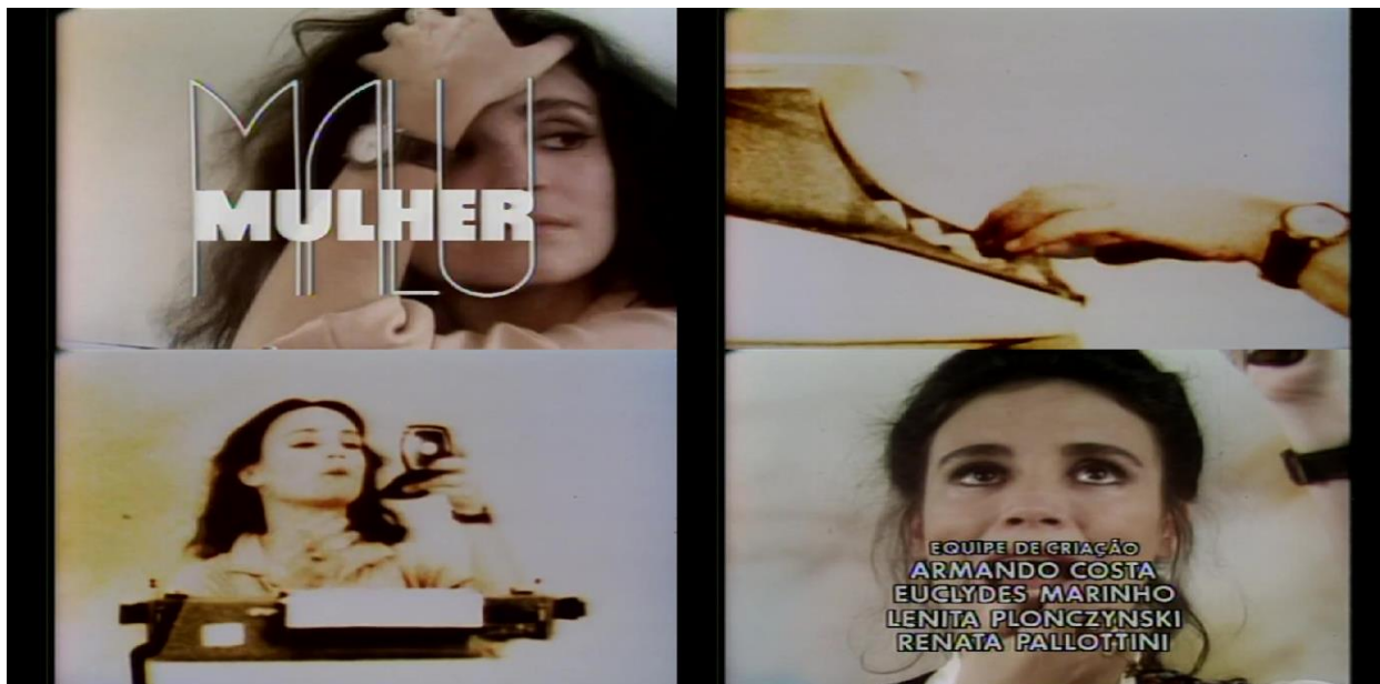
Figura 6: Algumas cenas da abertura do seriado.

Fonte: Print screen da abertura do seriado Malu Mulher capturado de acervo particular.