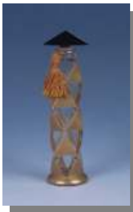
Figura 3 - Arlequinade, Les Parfums de Rosine 1920.

BAUDOT (2008), afirma que o estilista Paul Poiret inaugurou o conceito do perfume de costureiro.