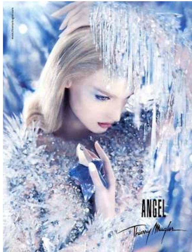
Figura 6 - Angel - Thierry Mugler

conseguiu destronar, em 1998, o mítico Nº 5 de Chanel de sua posição de líder das vendas. (LIPOVETSKY E ROUX, 2005, p. 164)