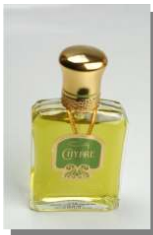
Figura 4 - Chypre - Coty

Outras fragrâncias, sem a assinatura de estilista de moda, também se destacaram à época: Quelques Fleurs, de Houbigant, o primeiro buquê floral moderno, Narcisse Noir, de Caron e L'Heure Bleue, de Guerlain. Mas coube a François Coty o lançamento, em 1917, de uma tendência que inspiraria muitas criações durante décadas: o legendário Chypre. A nova direção olfativa foi adotada rapidamente por Guerlain, com Mitsuoko.