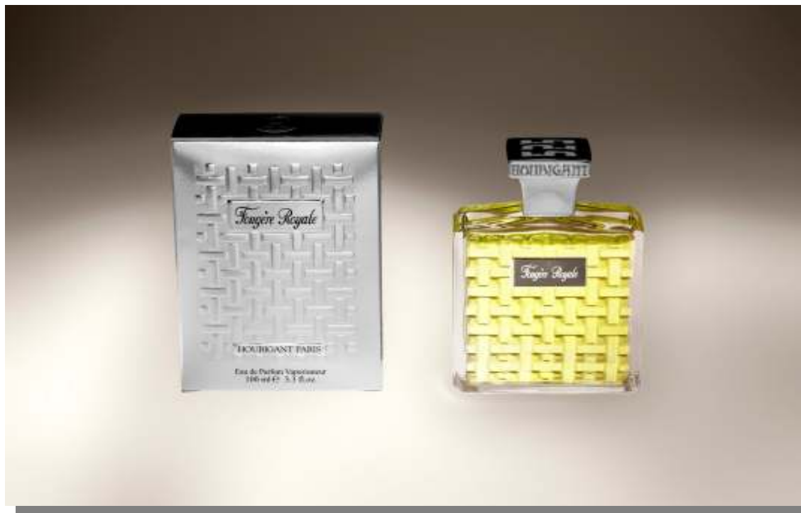
Figura 2 - Fougère Royale de Houbigant

Com o tempo, foram sintetizados os aromas de flores cujas fragrâncias não podiam ser obtidas por nenhum método de extração, como o lilás, lírio-do-vale e gardênia. Entre os grandes perfumes da época estavam Fougère Royale (Houbigant), com acento verde, o primeiro a levar cumarina, e Jicky (Guerlain), formulado com essências de íris, bergamota e lavanda. (ASHCAR, 2001, p. 48)