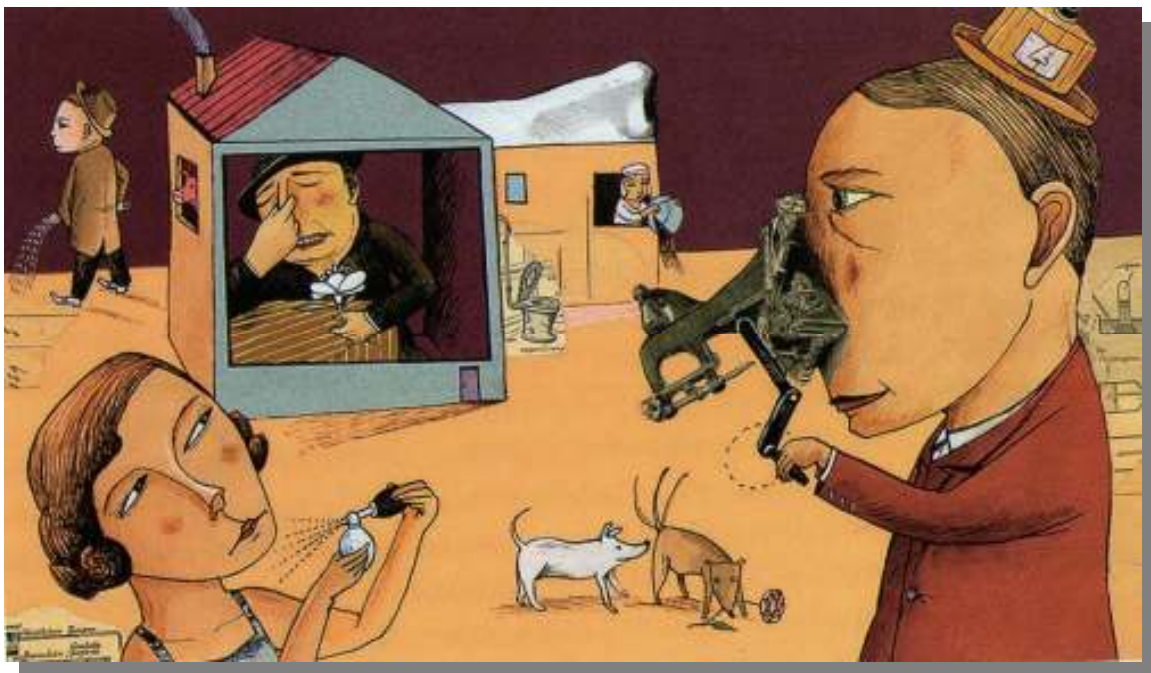
Figura 1 - Dada-odeur de Renaud Perrin, 2002

CANDAU (2007) afirma que, por idiosincrasia, a percepção dos odores é um evento subjetivo. Portanto, parece lógico concluir da impossibilidade de compartilhamento de uma experiência olfativa. Segundo ele, essa conclusão está equivocada: tanto é possível, que diversos profissionais são capazes de estabelecer diálogos através da identificação de aromas: os chefs experientes distinguirão, sem dificuldades, um ramo de alecrim de uma cebolinha; perfumistas discutirão, entre si, sobre um determinado aroma ou nota; enólogos reconhecerão, da mesma forma, os estímulos olfativos que identificam uma alteração no vinho. Como esse compartilhamento de experiências olfativas é possível? Graças a dois tipos de fatores em interação: naturais (capacidade de percepção dos odores, comum a todos – salvo em casos de patologias) e culturais (estabelecem-se definições, compartilhadas entre os interlocutores, para determinados aromas – por exemplo: atribuição do nome fougère a uma determinada classe de aromas, baseados em notas de lavanda, carvalho, musgo e cumarina).