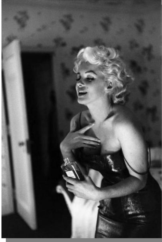
Figura 5 - Marilyn Monroe - Chanel N° 5