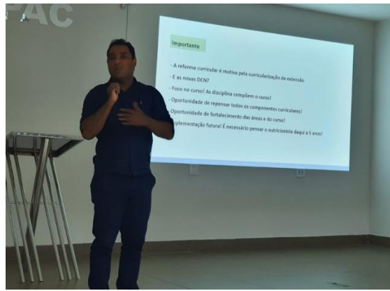
Imersão da Reforma Curricular realizada em 2022 no processo de construção do novo currículo