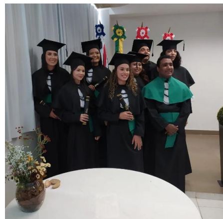
Participação em colação de grau dos estudantes do curso de Nutrição – 2023