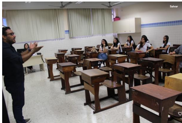
Apresentação do curso na 8ª Mostra de Profissões do Colégio Ibituruna – 2023