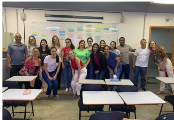
Imersão da Reforma Curricular realizada em 2022 no processo de construção do novo currículo

No Colegiado de Curso convocou e presidiu as reuniões, tendo o colegiado deliberado sobre pautas cotidianas do curso, mas também pautas de grande impacto, como aprovação da reforma do Manual de Estágio, Manual de TCC, Manual de Atividades Curriculares Complementares e criação do Manual de Atividades Curriculares de Extensão. Realizou a interlocução entre o Colegiado de Curso e NDE e demais comissões do curso.