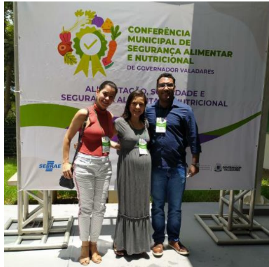
Participação na Conferência Municipal de Segurança Alimentar e Nutricional a convite da Prefeitura de Governador Valadares.