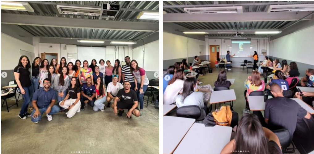
Recepção de calouros realizada em março de 2023 realizada em parceria com o DAEN