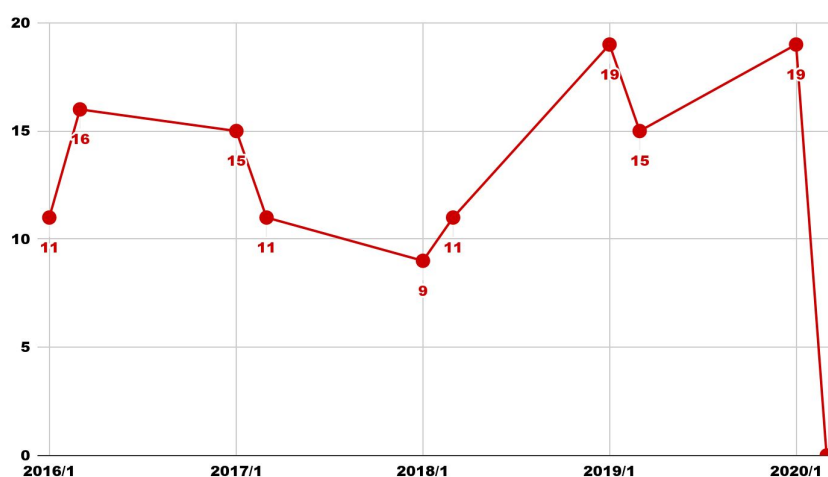
Intercambistas ingressantes por semestre