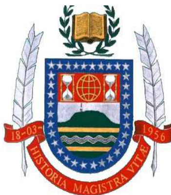
Ilustração 2: Brasão de Armas do Instituto Histórico e Geográfico de Juiz de Fora

Na parte superior da figura há um livro aberto, simbolizando o estudo; nas laterais, duas penas que simbolizam a escrita da história; no contorno do brasão há 34 estrelas que representam os 34 sócios fundadores do instituto, o que demonstra claramente quantos eram os intérpretes da história local; na parte interna do brasão há duas ampulhetas que simbolizam o tempo histórico; no centro das ampulhetas há um globo fazendo referência à geografia; embaixo destes símbolos estão representados o Morro do Cristo, o Paraibuna, o Caminho Novo e a Estrada União Indústria; no listel está representada a data de inauguração do IHGJF (18 de março de 1956), assim como as seguintes escrituras “ História Mestra da Vida ”.