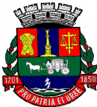
Ilustração 3: Brasão de Armas da cidade de Juiz de Fora

Contudo, torna-se notório que a maioria dos elementos escolhidos para representar a cidade em seu Brasão de Armas faz menção direta à história dos empreendimentos econômicos da cidade. Portanto, a construção da identidade desta comunidade está atrelada aos feitos da elite financeira de Juiz de Fora e não aos grupos subalternos silenciados pela história oficial.