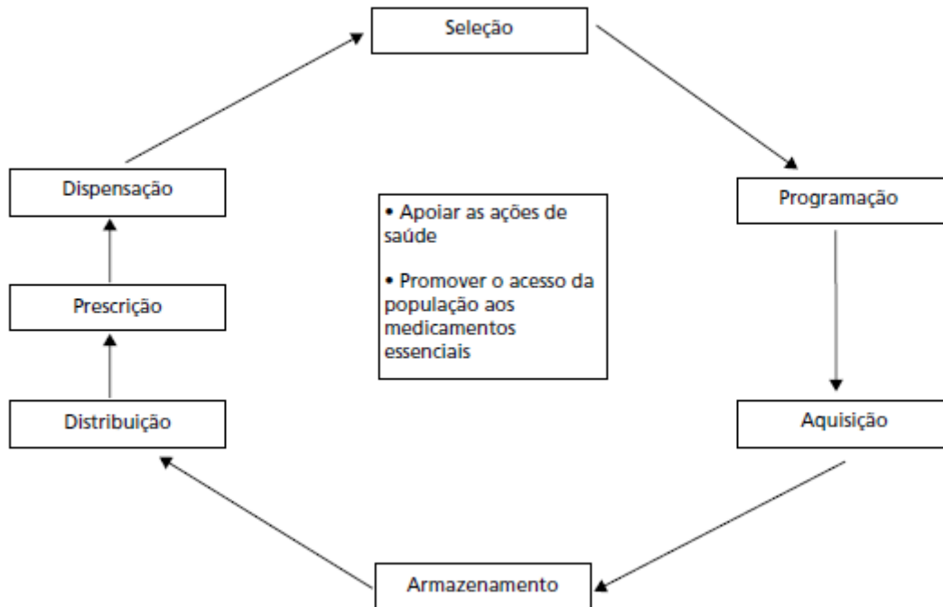
Figura 1: Ciclo da Assistência Farmacêutica