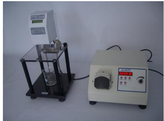
Figura 3: Aparelho de Fluxo Contínuo