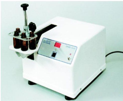
Figura 2: Aparelho Dinamizador

Pelo método do fluxo contínuo emprega-se um aparelho dinamizador (Figura 3) para promover diluição e agitação simultâneas. É colocada uma quantidade de insumo ativo e uma grande quantidade de água purificada que, através de mecanismo giratório, consegue alcançar altas diluições e é empregado para produção de formas farmacêuticas com ponto de partida a 30 CH (SANTOS; SÁ, 2014).