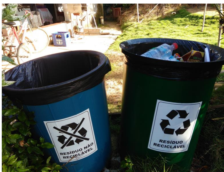
Figura 2: Lixeiras utilizadas no CEJHB para separação dos resíduos recicláveis e não-recicláveis

A Figura 2 corresponde às lixeiras dispostas nas residências dos funcionários localizadas dentro do Campo Experimental CEJHB. Já a Figura 3 mostra os modelos de lixeiras para recicláveis e não recicláveis dispostas na Sede, visando contemplar a infraestrutura de disposição e oferecer a correta separação dos resíduos.