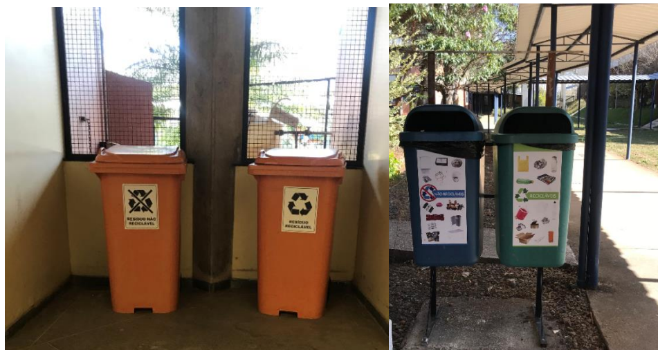
Figura 3: Lixeiras utilizadas na Sede para separação dos resíduos recicláveis e não-recicláveis