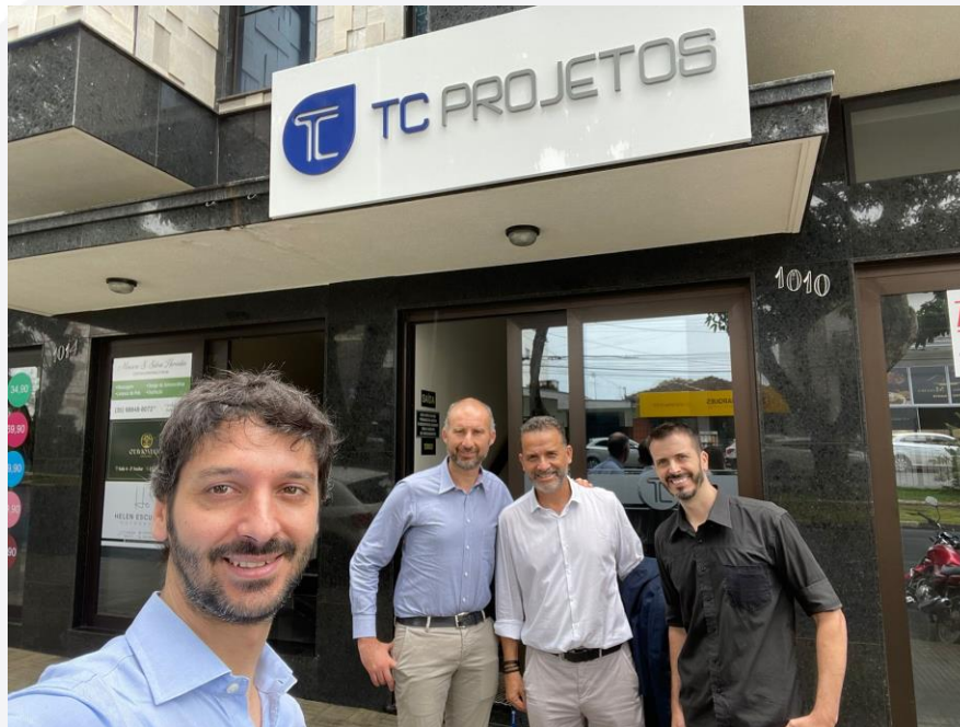
FOTO 6 – JANEIRO 2023 – CEO E DIRETOR VISITAM O ESCRITÓRIO GUAXUPÉ