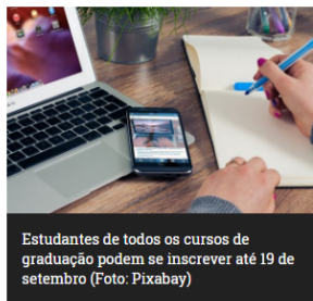
Estudantes de todos os cursos de graduação podem se inscrever até 19 de setembro

Estão abertas as inscrições para candidatura à "Bolsa de apoio à mobilidade internacional para acadêmicos de graduação envolvidos em atividades empreendedoras e de inovação". A seleção é do Centro Regional de Inovação e Transferência de Tecnologia (Critt), vinculado à Diretoria de Inovação da Universidade Federal de Juiz de Fora (UFJF). As inscrições devem