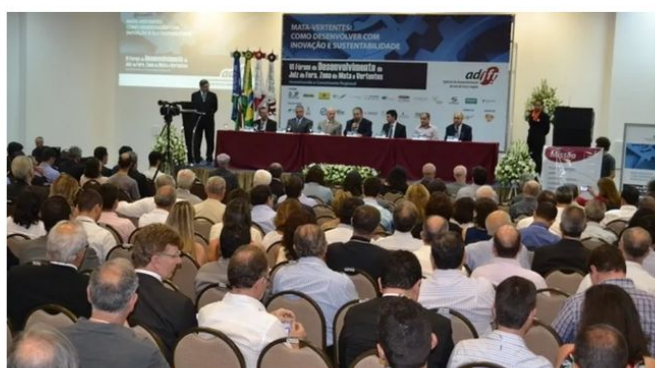
Fórum de Desenvolvimento Econômico/2019