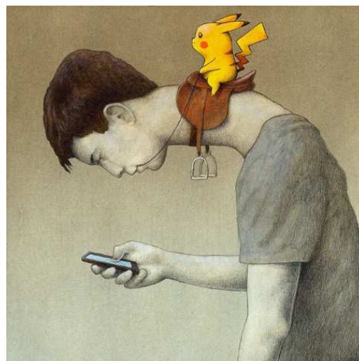
Imagem de Pawel Kuczynski

“A premissa do Pokémon Go é simplesmente que você usa seu GPS para encontrar Pokémons no ambiente real, e então usa sua câmera para torná-los visíveis, de modo que o mundo é ‘enriquecido’ pelo ato de olhar, por meio da tela, para o que está atrás dela. (...) Vivemos hoje numa distopia em que o Google e suas subsidiárias nos movem pela cidade em direções de sua escolha, loucamente e quase sem cessar, em busca de objetos de desejo, sejam eles um amante no Tindr , uma tigela de ramen japonês autêntico ou aquele ilusório Cleairy ou Picachu ”.