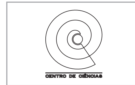
APLICAÇÃO DE CONTORNOS