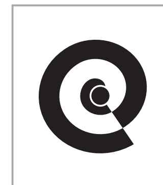
SÍMBOLO ISOLADO IMPRESSÃO: ESCALA DE CINZA OU MONOCROMÁTICA LIMITE DE REDUÇÃO: 5 MM