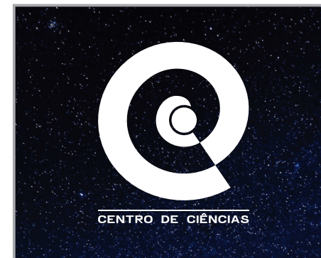
FUNDO COM IMAGEM MAJORITARIAMENTE ESCURA