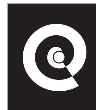
SÍMBOLO ISOLADO IMPRESSÃO: ESCALA DE CINZA OU MONOCROMÁTICA LIMITE DE REDUÇÃO: 5 MM