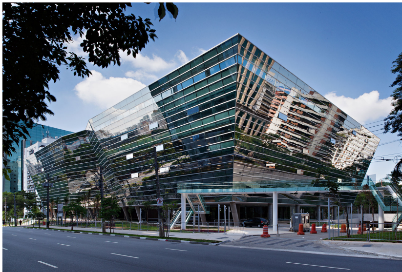
Figura 1: FL 3500.