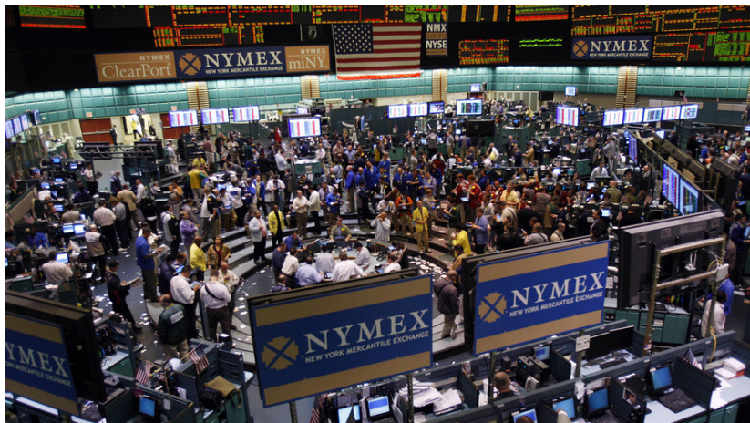
Figura 4: Mercado de ações.