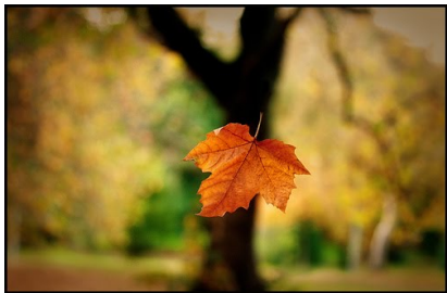
Figura 2: “Folha ao vento”.