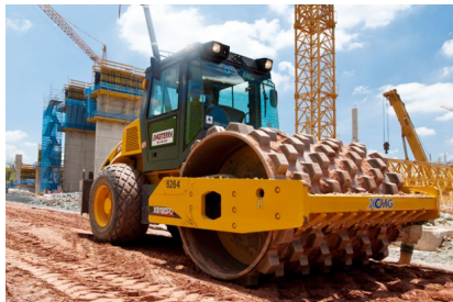
Figura 3: “Rolo compressor”.