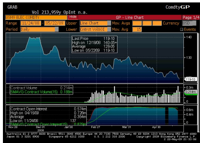
Figura 5: Painel da Bloomberg.