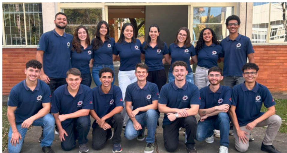
Membros do PET Civil UFJF no período 2024.1

Os grupos PET são organizados a partir de um curso ou área acadêmica, constituído por alunos deste. Na disposição atual do corpo discente do PET Civil UFJF, contamos com 18 vagas totais, sendo divididas em 12 vagas para alunos bolsistas e 6 vagas para voluntários. Quanto ao PET Civil da UFJF, por aqui já passaram mais de 80 alunos da graduação de Engenharia Civil e 5 tutores de diversas áreas. Atualmente, contamos com 12 alunos bolsistas, 2 voluntários e nossa tutora, professora Júlia Righi, do departamento de Transporte e Geotecnia.