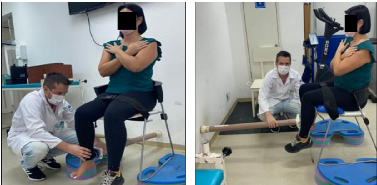
Figura 1: Dinamometria manual dos extensores e flexores de joelho e o uso do cano de PVC para estabilização.

Tanto a avaliação de extensores quanto de flexores de joelho foi mensurada com o participante sentado com o quadril e joelhos flexionados em 90° e com a orientação que os braços permanecessem cruzados na altura do tórax. Um cinto inelástico foi colocado sobre as coxas, distalmente à linha da articulação do quadril para estabilização. O dinamômetro foi posicionado 5 cm acima de uma linha bimaleolar imaginária e a outra extremidade acoplado no cano de PVC que foi estabilizado na parede (JACKSON et al. , 2017). A avaliação dos flexores prosseguiu de acordo com o protocolo adaptado de Muff et al. (2016) e a dos extensores de acordo com Jackson et al. (2017).