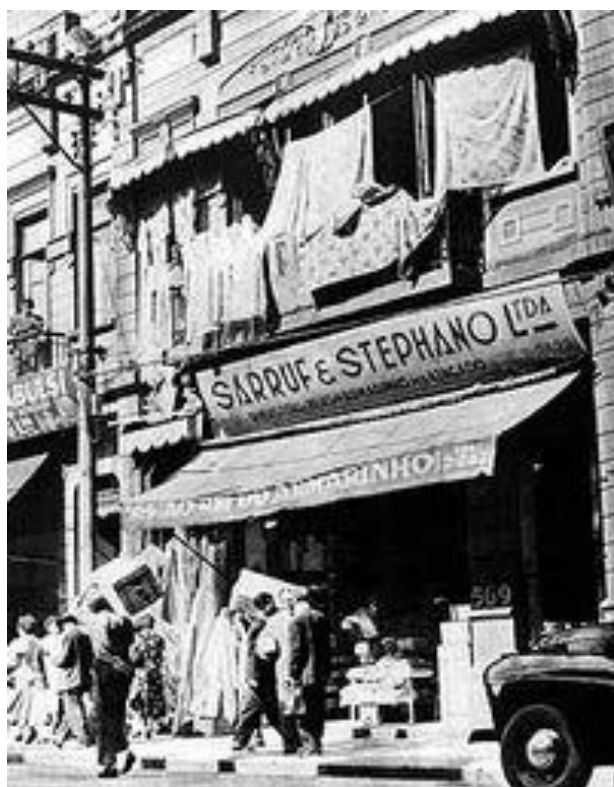
Ilustração 5 - Armarinho Sírio em São Paulo, 1950

Aos poucos os sírios e libaneses começaram a fabricar as roupas que vendiam e por volta de 1940, segundo Maleronka, tinham, em indústrias de roupas feitas, investimentos maiores do que os imigrantes de outras nacionalidades precedidos apenas pelos italianos no sul do país.