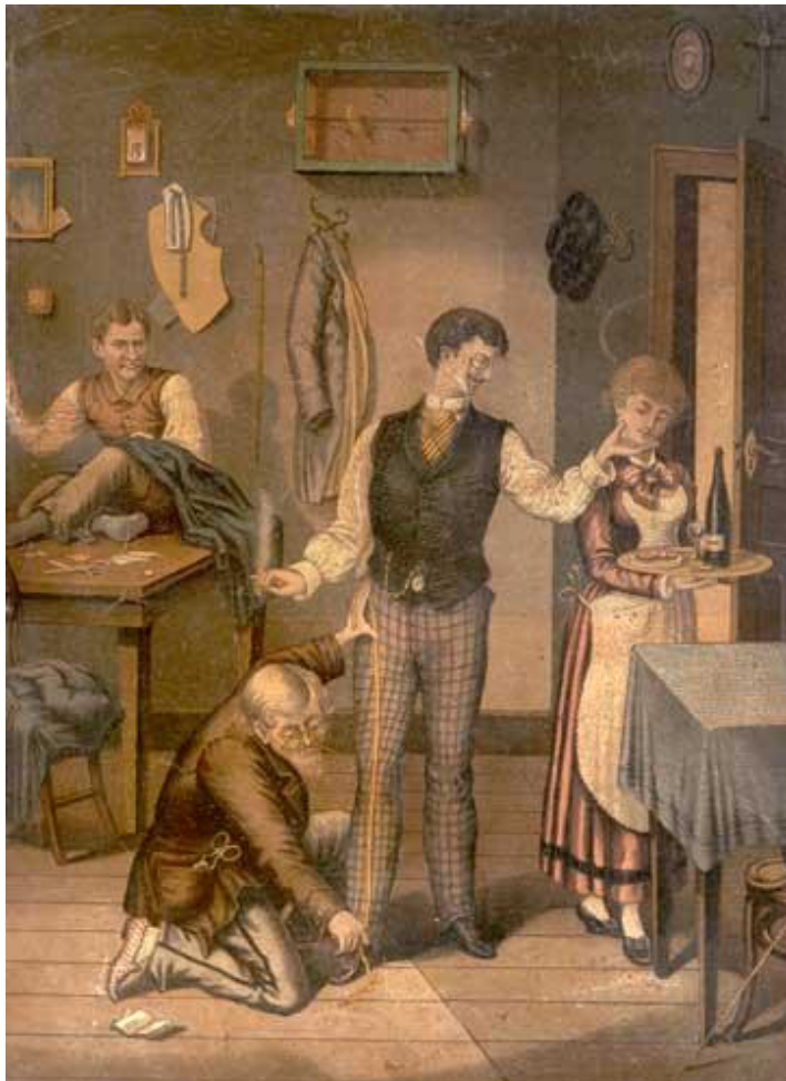
Ilustração 4 - Alfaiates, entre 1904 e 1934.

Alfaiates são profissionais que desenham, cortam, costuram e reformam roupas. Alguns trabalham como autônomos, podem atender clientes em casa, e fazer peças por encomenda, outros são registrados em indústrias de confecções, nas linhas de montagem de roupas. Também há a possibilidade de trabalharem em lojas, efetuando consertos, alargando ou ajustando as peças prontas ao corpo do cliente, ou na confecção de figurinos para espetáculos. Porém, os alfaiates tradicionais têm seu próprio ateliê.