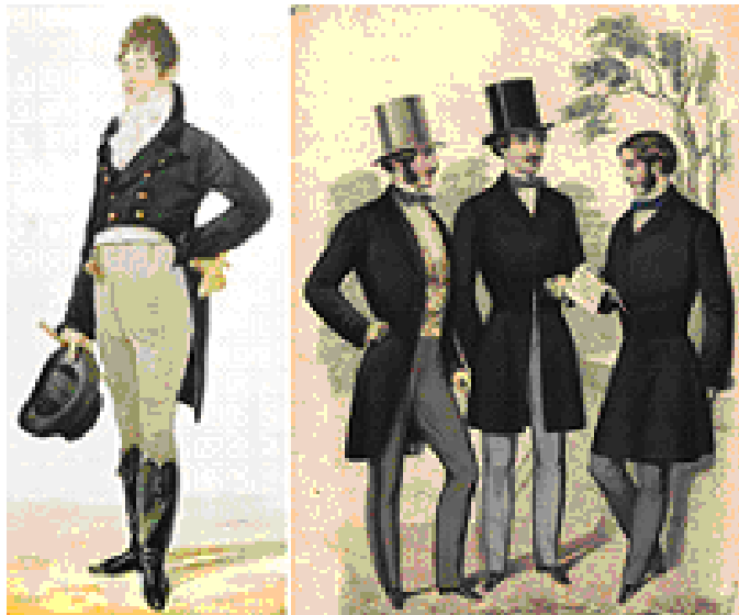
Ilustração 3 - Cavaleiros ingleses séc. XIX

Os alfaiates formavam uma classe bem organizada. Seu sindicato atuante era considerado um modelo entre os dos artesãos e conseguiu aumentar os salários durante a guerra. Quando os mestres necessitavam de mão de obra, recorriam ao sindicato, onde existia um livro com os nomes de seus membros, funcionando como agências de emprego. Os profissionais sindicalizados se alto denominavam “Cavaleiros da Agulha”.