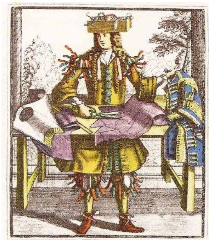
Ilustração 1 - Gravura retratando um dos alfaiates da corte de Versailles que, durante o reinado de Luis XIV ,tiveram a brilhante idéia de criar o traje, que viria a ser hoje, o terno executivo moderno. Era composto por três peças: o justaucorps (espécie de casaca longa), o colete longo e o culote .

A alfaiataria sempre foi um ofício exclusivamente masculino, o que garantia uma harmonia entre os tipos distintos de simbolismo sexual no vestuário, porém em 1675, durante o reinado de Luís XIV, “um grupo de costureiras francesas solicitou com sucesso a permissão para formar uma guilda de alfaiates femininos para confeccionar roupas para mulheres – iriam tornar-se as primeiras modistas”. (HOLLANDER, A.,p.88)