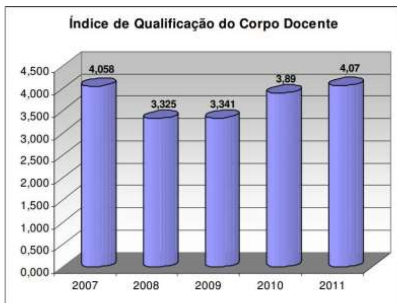
Gráfico 1 – Índice de qualificação do corpo docente da UFJF