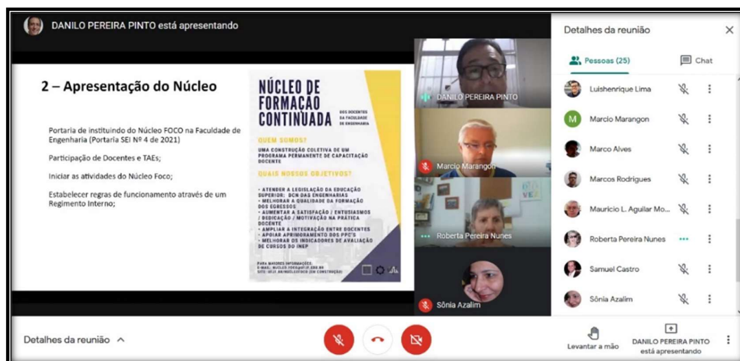
Figura 02: Apresentação Núcleo FOCO aos professores FACENG