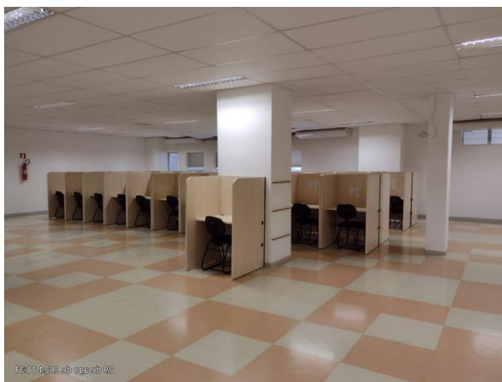
Figura 11 – Cabines de estudo individual