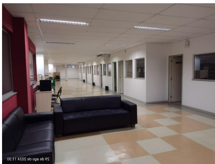
Figura 9 – Salas de estudo em grupo