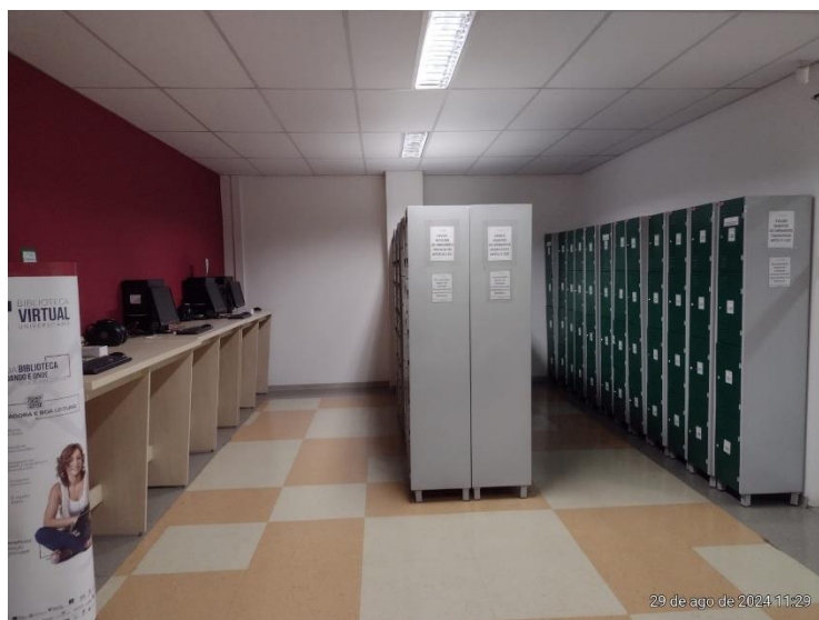
Figura 6 – Guarda volume