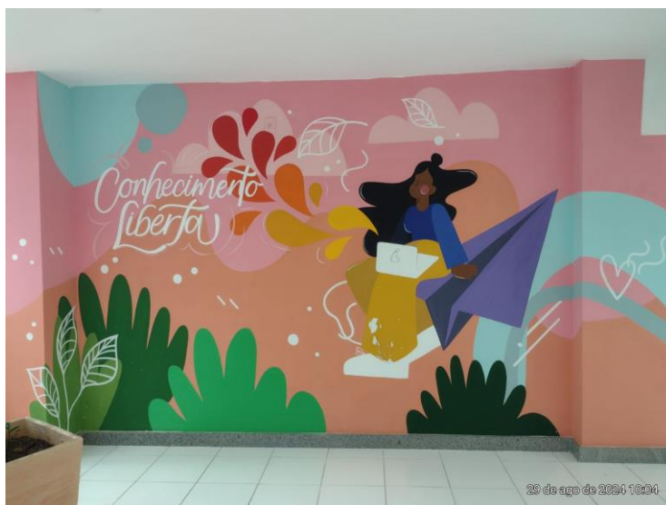
Figura 2 - Andar térreo