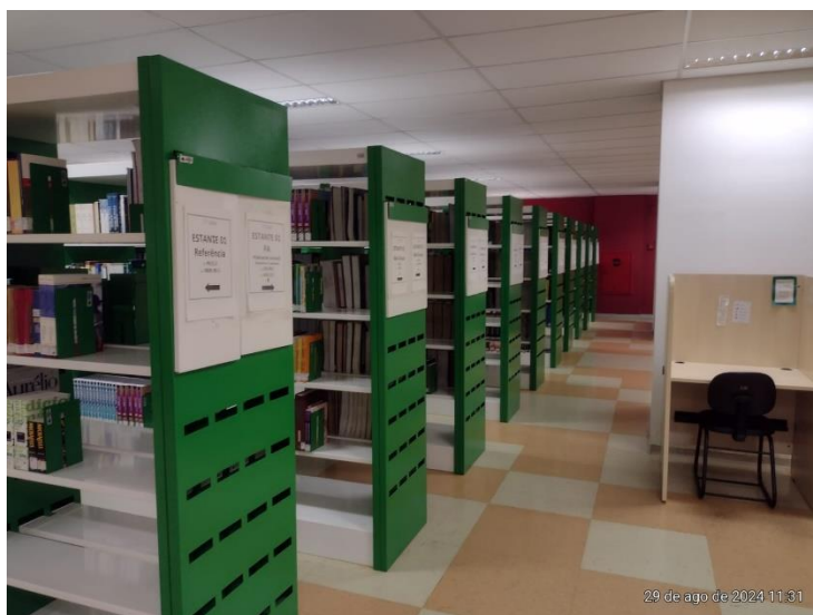
Figura 12 - Acervo