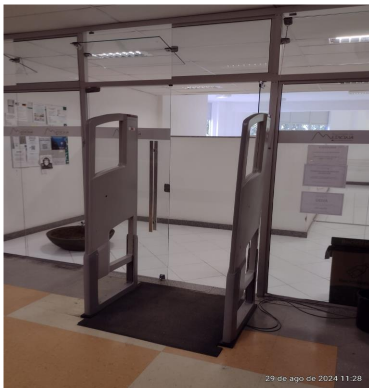
Figura 4 - Portal de segurança