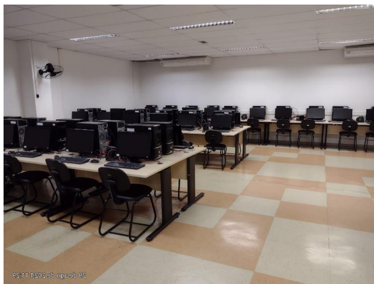
Figura 7 - Infocentro