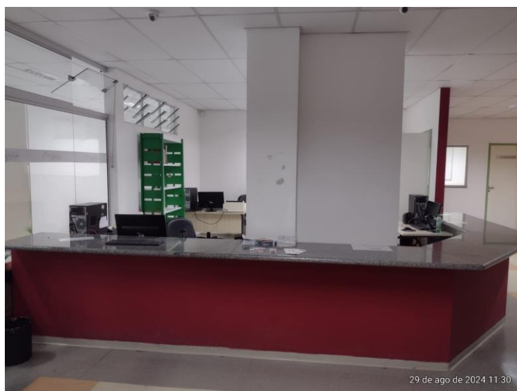
Figura 5 – Atendimento