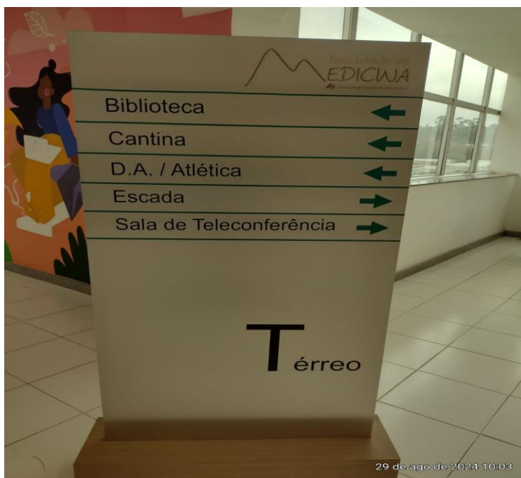
Figura 3 - Placa indicativa