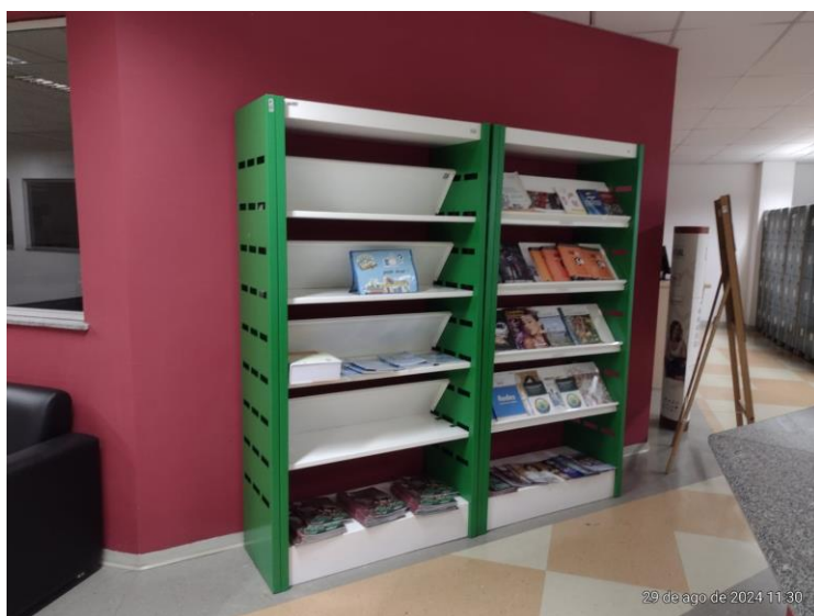
Figura 13 – Estante livre