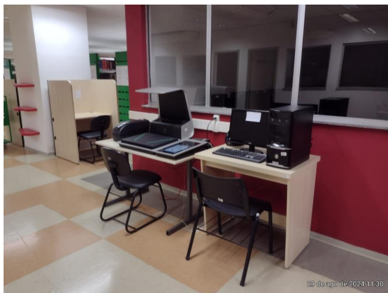
Figura 8 – Scanner Planetário