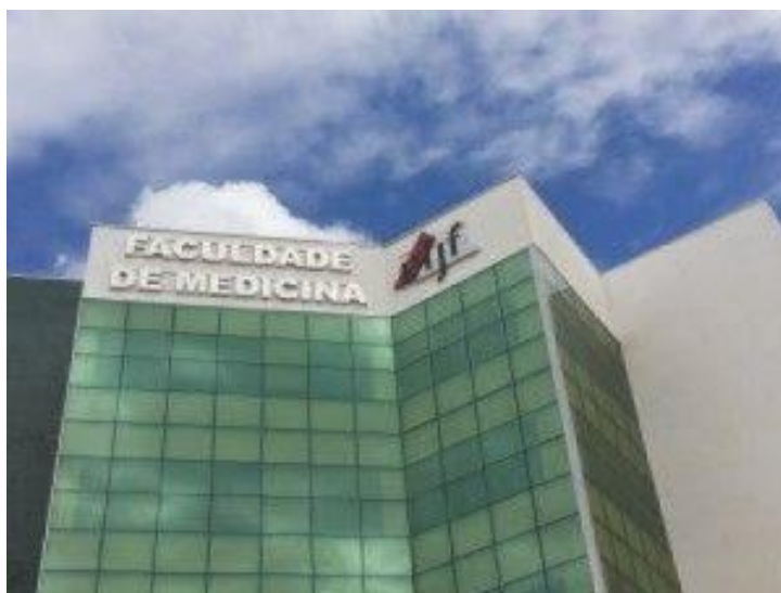
Figura 1- Faculdade de Medicina