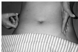
Figura4: Teste do piparote

- Teste do piparote: com uma das mãos, o examinador golpeia o abdome com piparotes, enquanto a outra mão, espalmada na região contra lateral, capta ondas líquidas que se chocam com a parede abdominal.