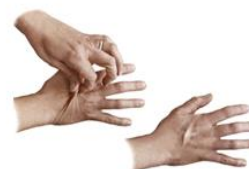
Figura 02: Prega cutânea