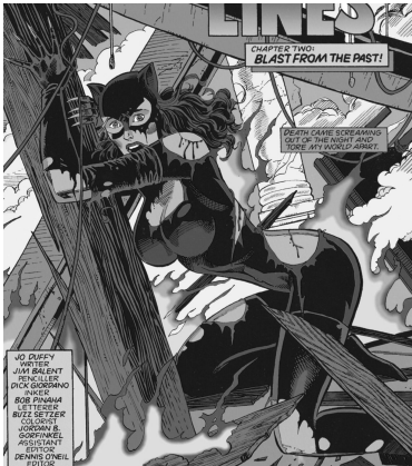
Figura 1 - Catwoman (1993 n 2)

Ainda segundo Rich (1993 apud Carvalho, 2018), “a mensagem mais perniciosa transmitida pela pornografia é a de que as mulheres são presas sexuais naturais dos homens e que elas gostam disso, que a sexualidade e violência são congruentes”. Seguindo esse argumento, não é de se admirar que dentro das histórias em quadrinhos as personagens em perigo são descritas não somente como damas indefesas, mas em posições objetificantes, mesmo quando o contexto é de violência.