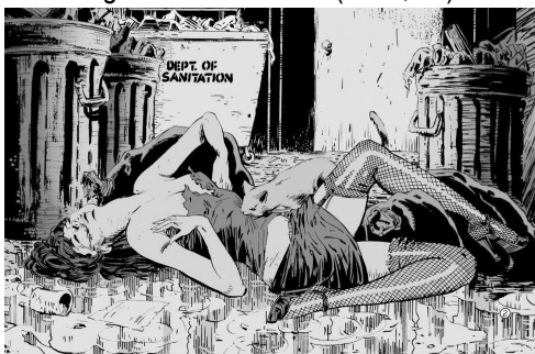
Figura 3 - Catwoman (1989, n1)