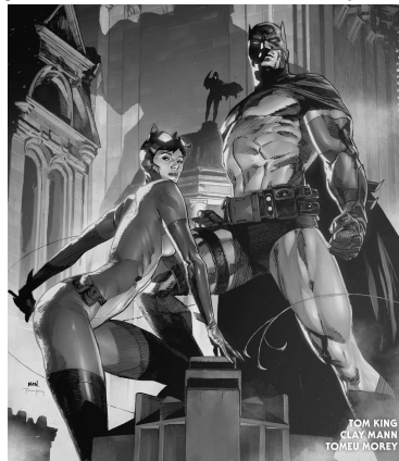
Figura 10 - Batman/Catwoman (2020 n 2)