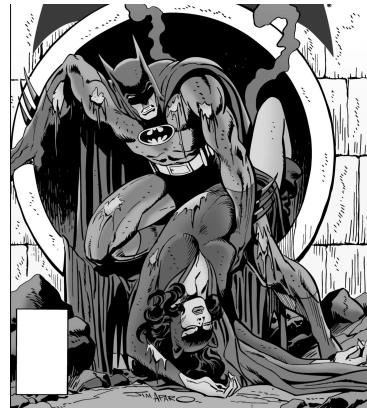
Figura 2 - Batman (1940 n 324)