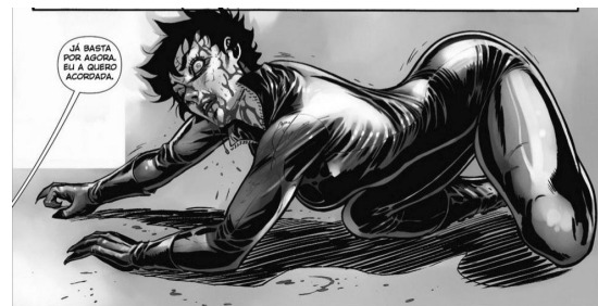
Figura 4 - Catwoman (2011, n 2)