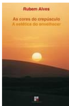
Figura 1- Livro As cores do crepúsculo A estética do envelhecer