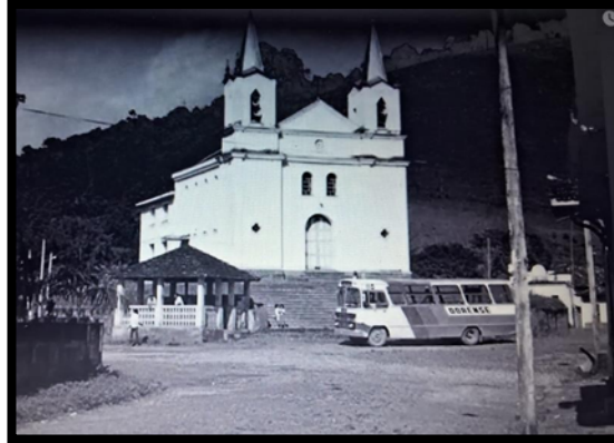
Figura 2: A igreja da cidade.

Os primeiros habitantes da região foram os povos indígenas, entre eles os Krenak, que tradicionalmente habitavam as margens do Rio Doce, no município de Resplendor, localizado na região Leste de Minas Gerais, conforme apresentado no documentário de Gabriel Fortes (2022). A formação histórica de Dolores do Paraibuna está marcada por um processo complexo e, muitas vezes, violento, resultado da expansão econômica que devastou a densa Mata Atlântica outrora predominante na região.