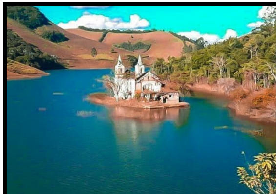
Figura 3: Dolores nos dias de hoje

Outro grupo relevante é o dos Puris, que vêm se reestruturando em municípios da Zona da Mata mineira, como Araponga, Piau e Viçosa, além de Barbacena. A emergência étnica desses povos é um fenômeno recente, refletindo um processo contínuo de reafirmação identitária e resistência cultural.