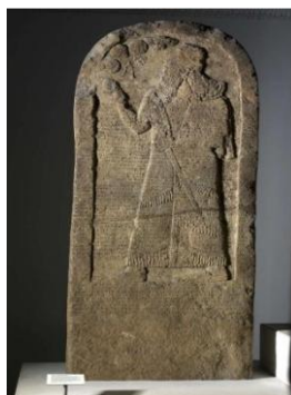
FIGURA 3 – ESTELA DE KURKH

A Batalha de Qarqar (853 AEC.), travada às margens do rio Orontes, não resultou em uma vitória decisiva para os assírios, embora Salmaneser III a tenha registrado como um triunfo em suas inscrições. A resistência da coalizão conseguiu frear, temporariamente, a expansão assíria, mas, nas décadas seguintes, a fragmentação política entre os reinos sírio-palestinos permitiu que a Assíria retomasse suas campanhas com sucesso.