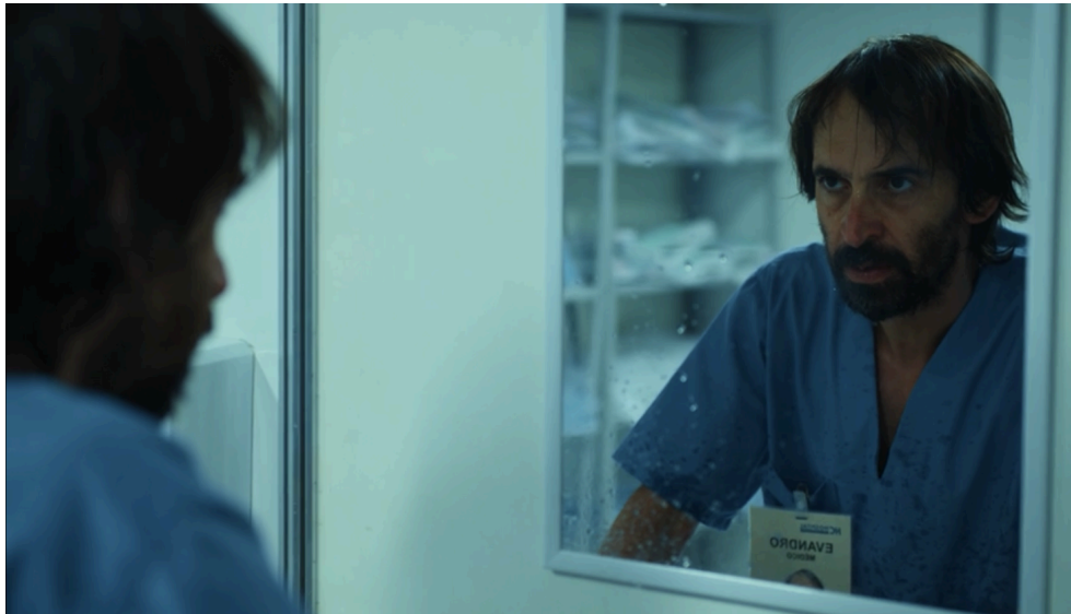
Figura 6 - A autoanálise.

fortemente determinadas por elementos sociais, valores e interações comunitárias. Esse enfoque reconhece que as emoções não são meramente experiências individuais, mas também são construções sociais que se adaptam conforme o ambiente cultural e as circunstâncias. A sociologia das emoções se dedica à análise das formas como essas emoções são manifestadas, controladas e interpretadas em diversos contextos sociais, e como elas moldam o comportamento humano, os laços sociais e as estruturas institucionais.