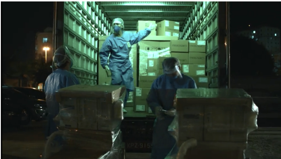
Figura 3 - Carga errada de carrinhos de anestesia.

Além de enfrentar as frustrações do trabalho, esses profissionais também lidavam com a ansiedade e medo dos familiares em perder um ente para a doença. Como na imagem acima, a mulher estava desesperada querendo entrar dentro do hospital de campanha para ver o esposo, sendo que na situação, não podiam deixar entrar visitas, devido o alto risco de contágio. A enfermeira tinha saído para tomar um ar, e viu a mulher nessa situação, mesmo explicando que era um risco, ela insistia em entrar, então a solução que a enfermeira encontrou foi de gravar um vídeo da mulher para o marido e vice-versa. Uma representação fiel da realidade, pois assim, era uma maneira de manter o contato entre os elos, e amenizar a dor do outro.