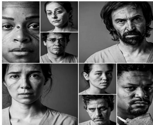
Figura 1 - Personagens da série.