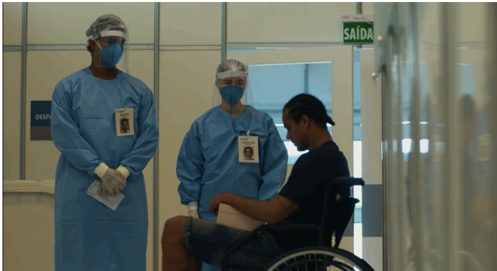
Figura 9 - A morte e seus impactos.

Em um hospital, a morte é uma inquilina, infelizmente uma hora o nosso ciclo acaba, e com isso vem as reações das emoções. Na produção sobre a pandemia, não seria diferente. Na figura acima, vemos a equipe de saúde informando ao jovem que a sua irmã que internou junto com ele faleceu, isso fruto da irresponsabilidade dele, pois enquanto ela tomava todos os cuidados, o mesmo frequentava festas clandestinas. As emoções acerca da morte impactam tanto na equipe quanto no irmão da jovem. Sobre a antropologia da dor Sarti diz: