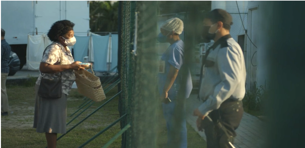
Figura 2 - O medo dos familiares.

Além de enfrentar as frustrações do trabalho, esses profissionais também lidavam com a ansiedade e medo dos familiares em perder um ente para a doença. Como na imagem acima, a mulher estava desesperada querendo entrar dentro do hospital de campanha para ver o esposo, sendo que na situação, não podiam deixar entrar visitas, devido o alto risco de contágio. A enfermeira tinha saído para tomar um ar, e viu a mulher nessa situação, mesmo explicando que era um risco, ela insistia em entrar, então a solução que a enfermeira encontrou foi de gravar um vídeo da mulher para o marido e vice-versa. Uma representação fiel da realidade, pois assim, era uma maneira de manter o contato entre os elos, e amenizar a dor do outro.