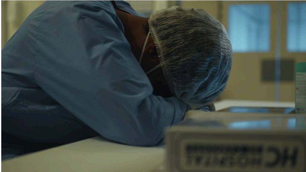
Figura 4 - O médico plantonista descansa na bancada de medicação.

Conforme argumentado por Boaventura Santos, desde a ascensão do neoliberalismo como a faceta preponderante do sistema capitalista, temos testemunhado uma condição constante de instabilidade. Essa perpetuidade da crise, ao se estabelecer, acaba se tornando a justificativa primordial para uma série de desdobramentos, como a contínua crise financeira que resulta em cortes nas políticas sociais (tais como saúde e educação), obscurecendo, assim, a investigação de suas raízes profundas. O propósito subjacente dessa crise perene reside na sua manutenção, pois sua persistência legitima a concentração de riqueza e o aumento das disparidades sociais. A pandemia apenas intensifica essa situação de crise à qual a comunidade global tem sido submetida, deixando à mercê os mais vulneráveis.