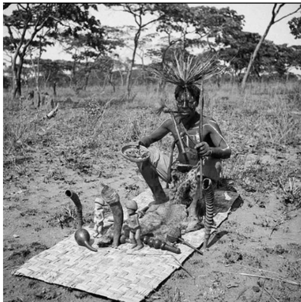
Figura 2: Kimbando Mbundo com seus fundamentos - 1935.

com isso sofreram as agressões do tempo e da história; seja pelos Yorubá terem uma ascendência mais recente em território nacional 17 . Destaca-se a importância do doutor Bunseki Fu Ki. Au para compreender as atuais discussões que estão sendo construídas sobre as religiosidades afro diaspóricas e a origem bantu da Umbanda.