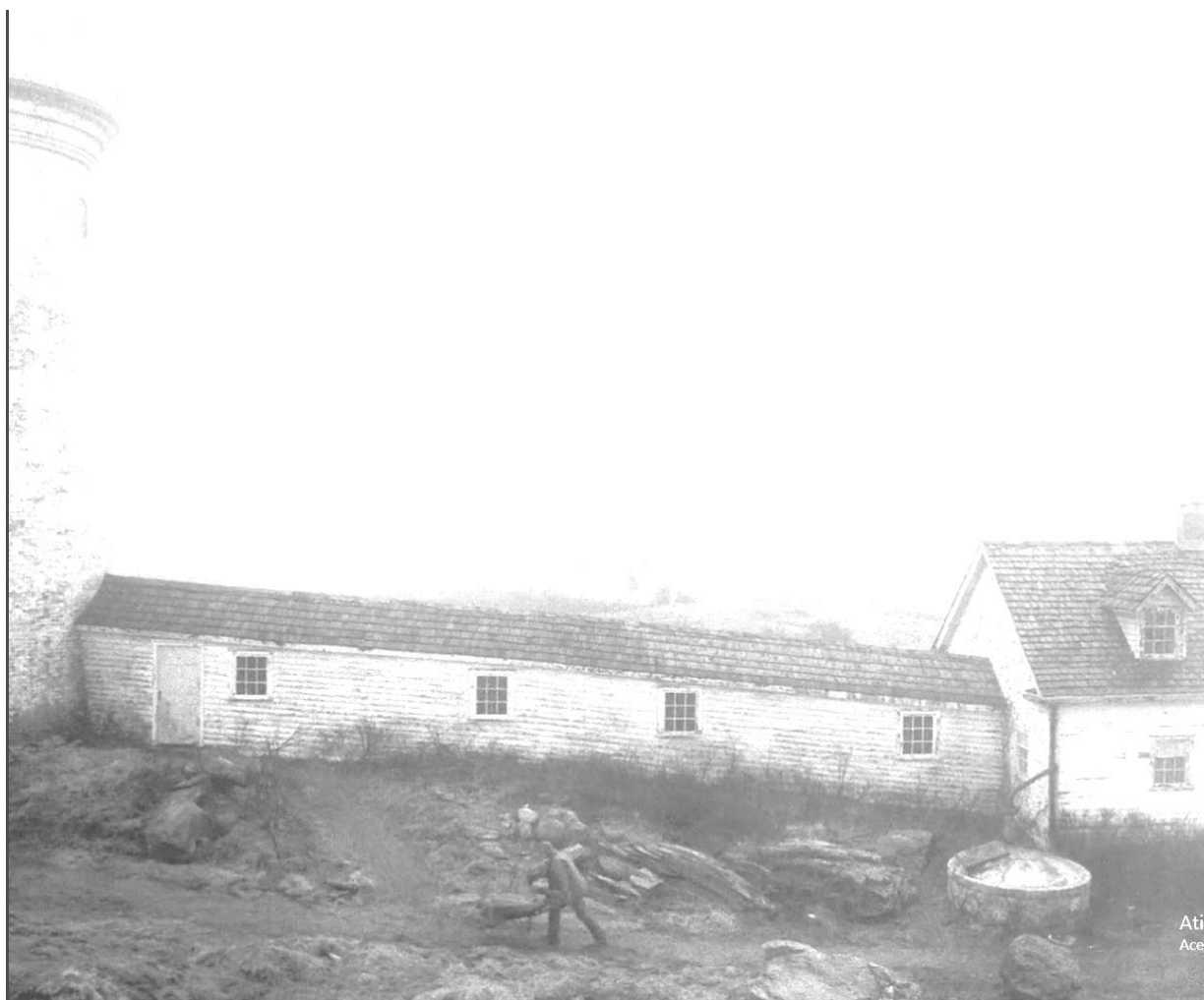
Figura 06 - Ephraim trabalhando