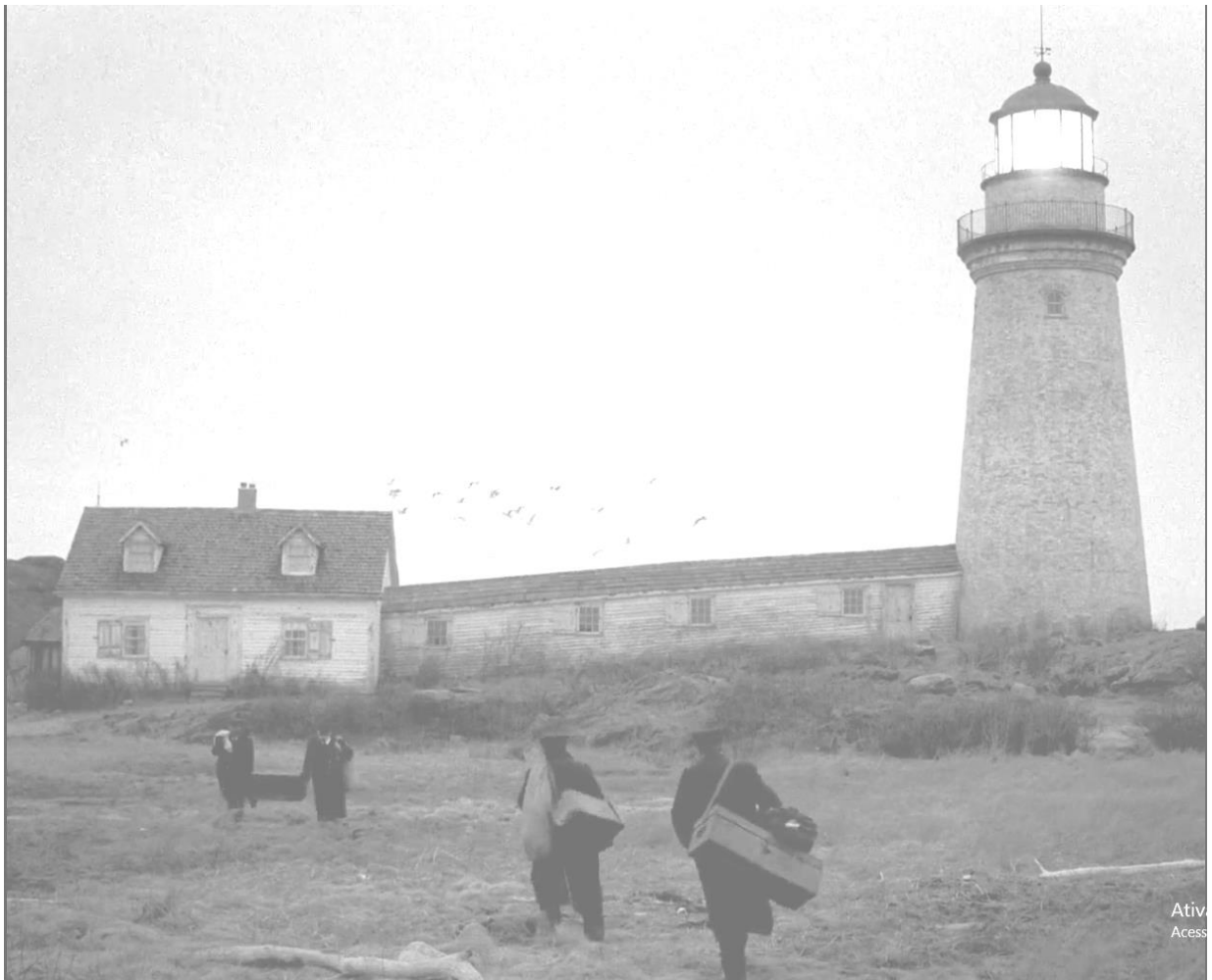
Figura 02 - Vida

processo futuramente com um novo discípulo. O filme embala quase todos esses momentos em uma trilha sonora soturna, somada à um matiz cinzento de um clima nublado, o que nos transpõe uma imagética fúnebre, como a chegada de dois seres vivos a seu local de morte. Uma representação dessa ideia nos é dada pelo próprio diretor logo nos primeiros planos, em um dualismo "vida e morte" nos planos mostrados nas Figuras 02 e 03: