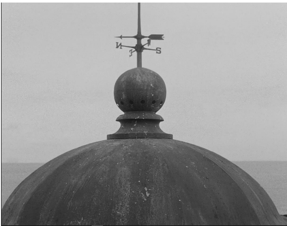
O farol (2020)