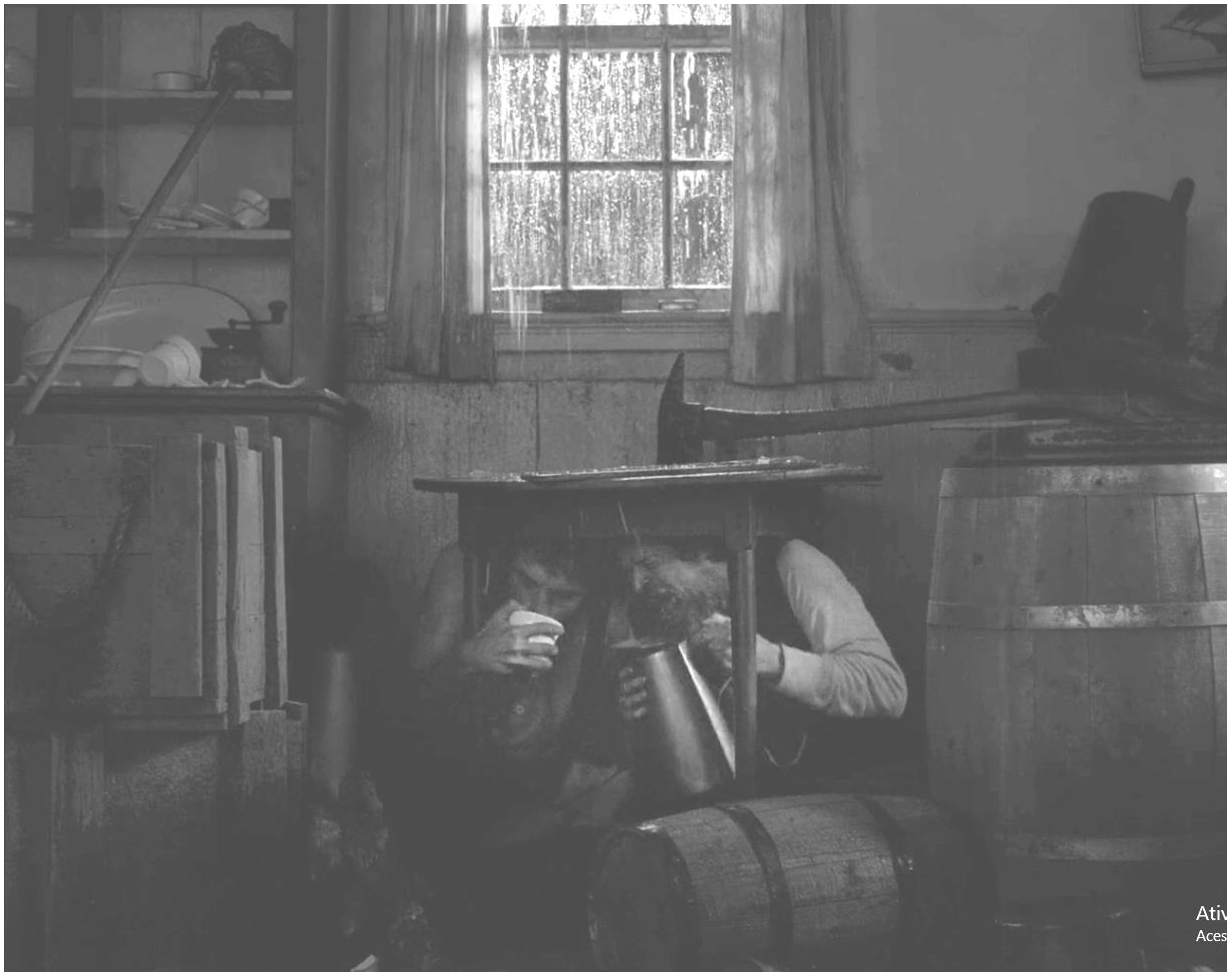
Figura 05 - Janela prestes a ser quebrada pelas águas