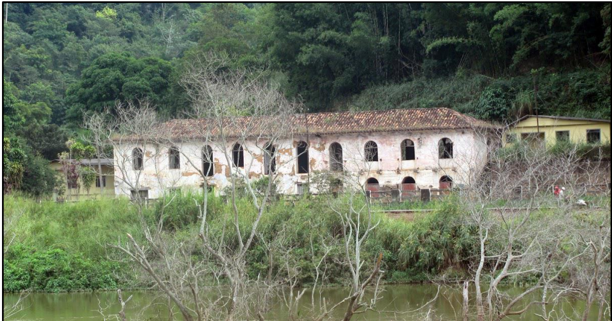
Figura 3 – Casarão do Registro do Paraibuna

O prédio teve outras funções após o fim das atividades de Registro. Teria sido até mesmo utilizado como hotel, para servir à Estrada da Companhia União & Indústria (Esteves e Lage, 1915)