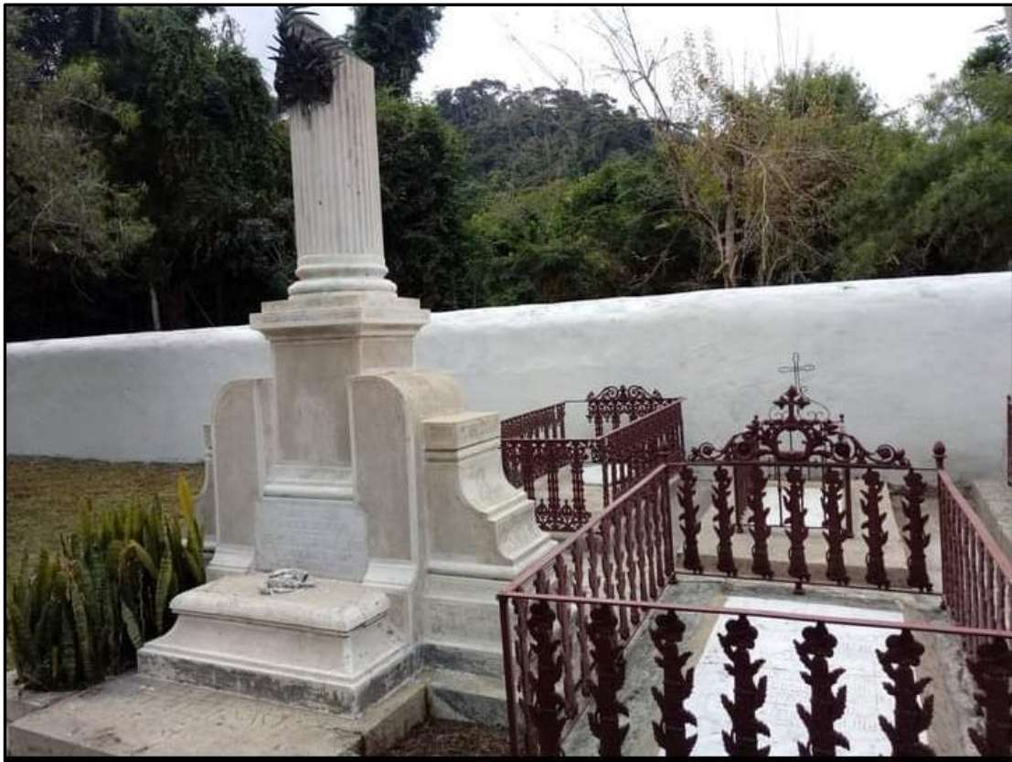
Figura 2 – Vista parcial do Cemitério Rocinha da Negra